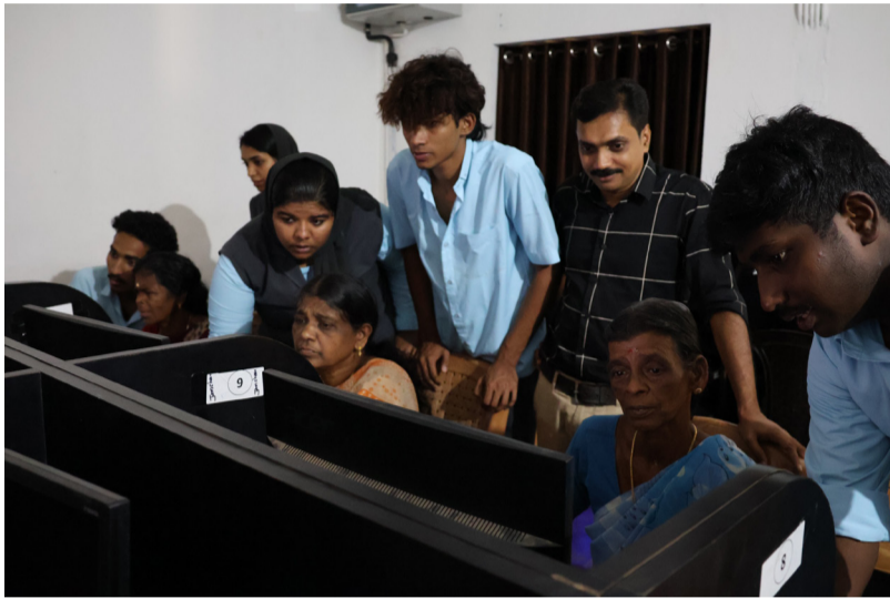
വിദ്യാർത്ഥികൾ കമ്പ്യൂട്ടർ പരിശീലനം നൽകുന്നു

പുക്കോട്ടൂർ വയോജനങ്ങൾക്ക് കമ്പ്യൂട്ടർ സാക്ഷരതയുമായി വിദ്യാർത്ഥികൾ. എൻ.എസ്.എസ് വിദ്യാർത്ഥികളാണ് വയോജനങ്ങൾക്ക് കമ്പ്യൂട്ടർ പരിശീലനം നൽകിയത്. ലോക വിവര വികസന ദിനത്തോടനുബന്ധിച്ച് തുടക്കം കുറിച്ച പരിശീലന ക്ലാസിലാണ് വിദ്യാർത്ഥികൾ അധ്യാപകരായത്. കോളേജിന്റെ പരിസര പ്രദേശങ്ങളിലുള്ള വയോജനങ്ങളാണ് വിദ്യാർത്ഥികളായി കോള