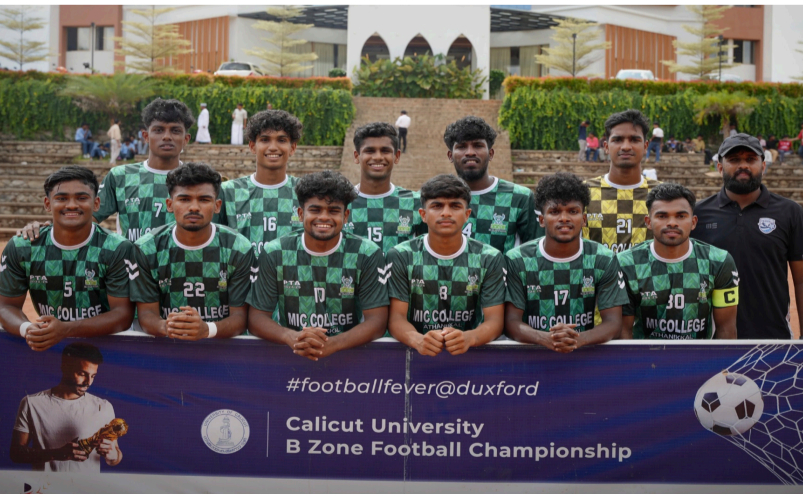
ടീം അംഗങ്ങളും പരിശീലകരും

കാലിക്കറ്റ് യൂണിവേഴ്സിറ്റി ബി സോൺ ഫുട്ബോൾ ചാമ്പ്യൻഷിപ്പിന് 2024-25 തുടക്കം കുറിച്ചു. 2024 ഒക്ടോബർ 17 മുതൽ 29 വരെ ഷെയ്യൂൾ ചെയ്തിരിക്കുന്ന ടൂർണമെന്റ് മുൻനിര ടീമുകൾ തമ്മിലുള്ള കടുത്ത മത്സരം നടന്നു. കാലിക്കറ്റ് യൂണിവേഴ്സിറ്റി ബി സോൺ ഫുട്ബോൾ ചാമ്പ്യൻഷിപ്പിൽ എം.ഇ.എസ് കുറ്റിപ്പുറത്തിനെ 6:1 സ്കോർ പരാജയപ്പെടുത്തി എം.ഐ.സി അത്താണിക്കൽ ജേതാവായി. ഫൈനൽ മത്സരത്തിൽ എൻ.സി.എസ്.ടി. കോളേജിനെ പരാജയപ്പെടുത്തി എം.ഐ.സി ജേതാക്കളായി.