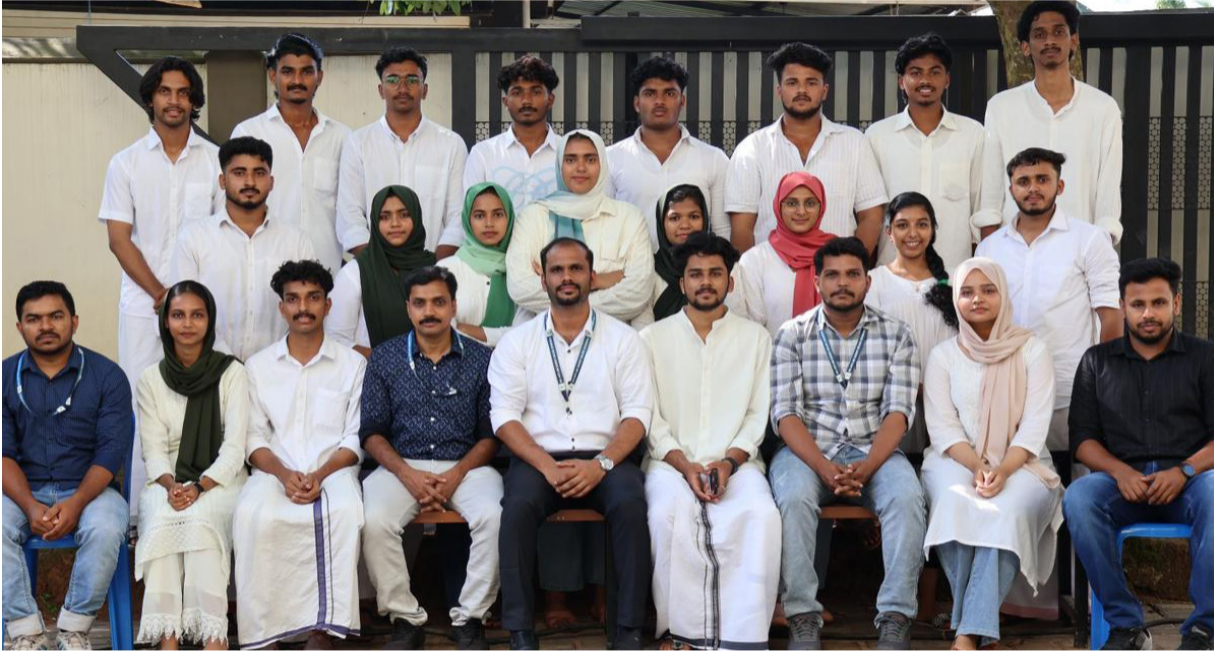
സത്യപ്രതിജ്ഞ ചെയ്ത യൂണിയൻ ഭാരവാഹികളും അധ്യാപകരും