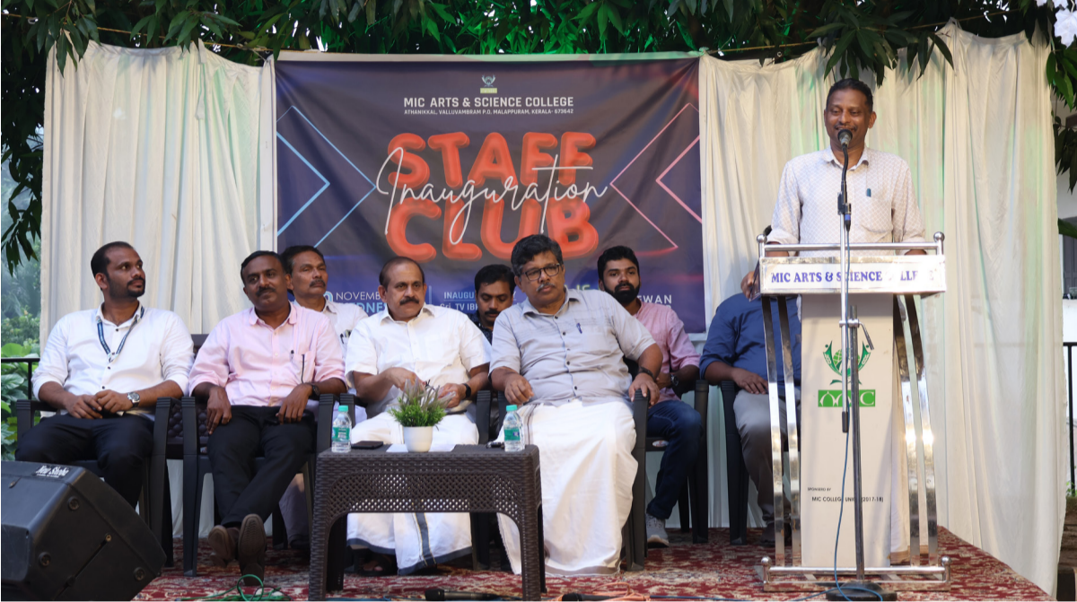
കോളേജിലെ അധ്യാപകർ ചേർന്നുകൊണ്ട് സ്റ്റാഫ് ക്ലബ്ബ് പ്രോഗ്രാമിന് തുടക്കം കുറിച്ചപ്പോൾ