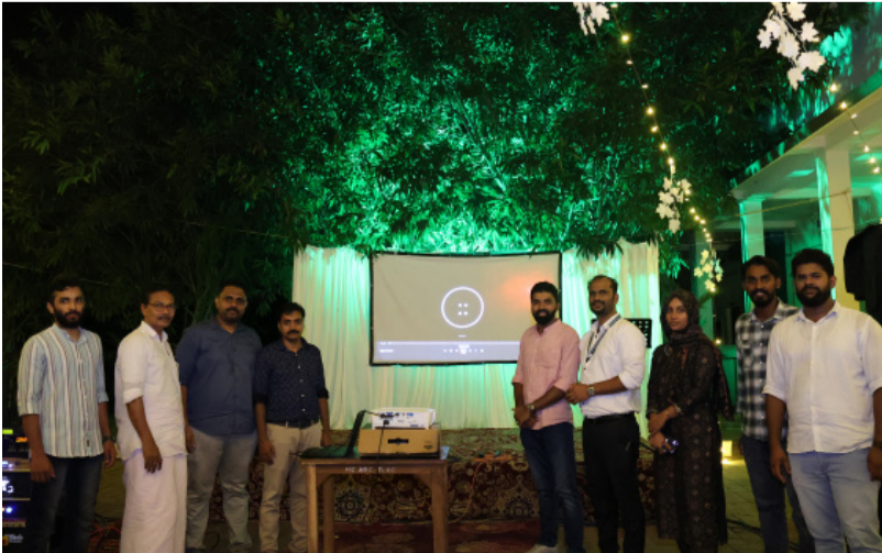
സ്റ്റാഫ് ക്ലബ്ബിന്റെ ലോഗോ കോളേജ് സുപ്രണ്ട് പ്രകാശനം ചെയ്തു.

കോളേജിനടുത്ത് പുതുതായി പണി ത പള്ളിയുടെ ഉദ്ഘാടനം പതിനൊന്ന് തികൾ വൈകുന്നേരം ആറുമണിക്ക് പാണക്കാട് സാദിഖലി തങ്ങൾ നിർവഹിച്ചു. കോളേജിൽ പഠിക്കുന്ന ആയിരത്തോളം വിദ്യാർത്ഥികൾക്കും കോളേജ് സ്റ്റാഫിനും മൂലക്കോട് പരിസരവാസികൾക്കും പ്രാർത്ഥനക്ക് കൂടുതൽ മെച്ചപ്പെട്ട സംവിധാനം ഒരുക്കുക എന്ന ലക്ഷ്യം മുൻനിർത്തിയാണ് മൂലക്കോട് പുതിയ പള്ളി നിർമ്മിച്ചത്. ഉദ്ഘാടന ചടങ്ങിൽ നാട്ടുകാരും വിദ്യാർത്ഥികളും പങ്കെടുത്തു.