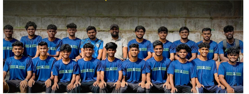
കോളേജ് ഫുട്ബോൾ ടീം

കാലിക്ട്രിയ യൂണിവേഴ്സിറ്റി ബി സോൺ ചാമ്പ്യൻഷിപ്പിൽ എം ഐ സി കോളേജിന് ഒരു നേട്ടം കൂടി. ആറു വർഷത്തിനുശേഷമാണ് കോളേജ് ഫുട്ബോൾ ടീം ഇന്റർ സോൺ യോഗ്യത നേടിയത്. കാളികാവ് ടെക്സ് ഫോർഡ് ക്യാമ്പസിൽ വെച്ചു നടന്ന സി കോളേജ് ടീം പരാജയപ്പെട്ടു.