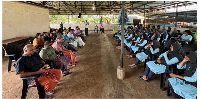
കോളേജ് വിദ്യാർത്ഥികൾ ഓർഫനേജിലെ അന്തേവാസികളുമായി സംവദിക്കുന്നു